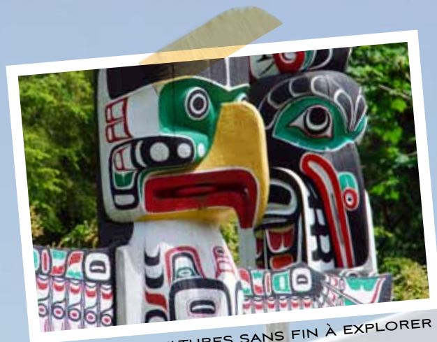
DES CULTURES SANS FIN À EXPLORER

les épreuves préliminaires et les sports moins en demande comme le biathlon. »