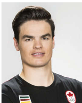
Mikaël Kingsbury Ski acrobatique