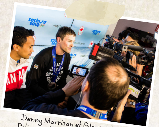
Denny Morrison et Gilmore Junio, Patinage de vitesse sur longue piste

LES TÉLÉDIFFUSEURS JOUENT UN RÔLE ESSENTIEL DANS LA PRÉSENTATION DES ÉVÉNEMENTS AUX MILLIARDS D'AMATEURS DES JEUX OLYMPIQUES DE TOKYO. UNE BONNE COUVERTURE DES JEUX PERMET AUX SPECTATEURS DE SUIVRE L'ACTION ET D'ENCOURAGER LEURS HÉROS. ET SI TU FAISAIS PARTIE DE L'ÉQUIPE DE DIFFUSION, SERAIS-TU À LA HAUTEUR?