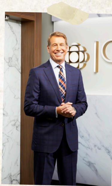
Photo offerte gracieusement par CBC Scott Russell, 14 années de couverture des compétitions olympiques -Animateur de l'émission Road to the Olympic Games et Olympic Game Primetime

Les Jeux olympiques ont le potentiel d'unir le monde, d'inspirer les jeunes et d'encourager les valeurs telles que l'amitié et le respect. Mais tous ces avantages dépendent de la diffusion. La couverture des Jeux olympiques permet aux gens de suivre l'action et de découvrir les histoires des athlètes. La diffusion permet au monde de voir les Jeux.