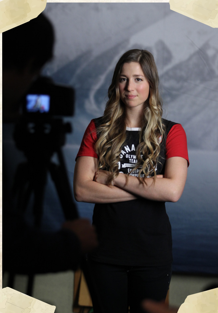
Chloé Dufour-Lapointe, Ski acrobatique

Un tel auditoire signifie que la diffusion des Jeux olympiques génère et rapporte beaucoup d'argent. Les principaux réseaux de télévision déboursent d'énormes sommes pour obtenir le droit de couvrir les Jeux. Pour ces réseaux, les Jeux sont une occasion de vendre des espaces publicitaires de premier plan aux grandes entreprises. Par exemple, le réseau NBC a payé 7,65 milliards $ US pour les droits de diffusion aux États-Unis. L'argent récolté par la vente de ces droits soutient les sports olympiques.