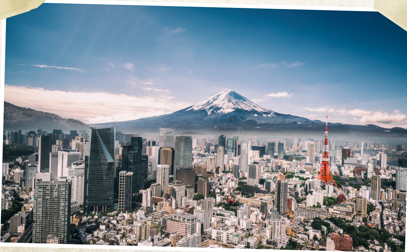
La ville de Tokyo

Un bon logo olympique en dit beaucoup sur la ville et le pays hôte. Les formes et les couleurs aident à présenter les Jeux. Le logo raconte un peu l'histoire du pays. Il peut être utilisé à différents endroits. Il doit être beau lorsqu'on le voit sur un petit billet. Il doit aussi être beau lorsqu'on le voit sur de gros bâtiments. Finalement, il doit être beau lorsqu'il est affiché en une seule couleur.