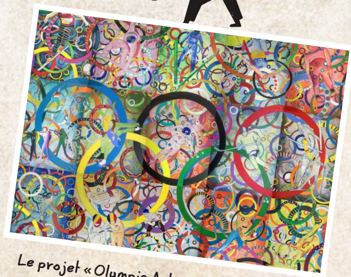
Le projet « Olympic Art » - PyeongChang

Lors des Jeux olympiques d'hiver de Pyeongchang 2018, on a demandé aux athlètes de créer de l'art. Les athlètes ont peint une image d'un sport d'hiver. Un nouveau tableau a été peint pendant chaque jour des Jeux. Tout cela faisait partie du projet « Olympic Art ».