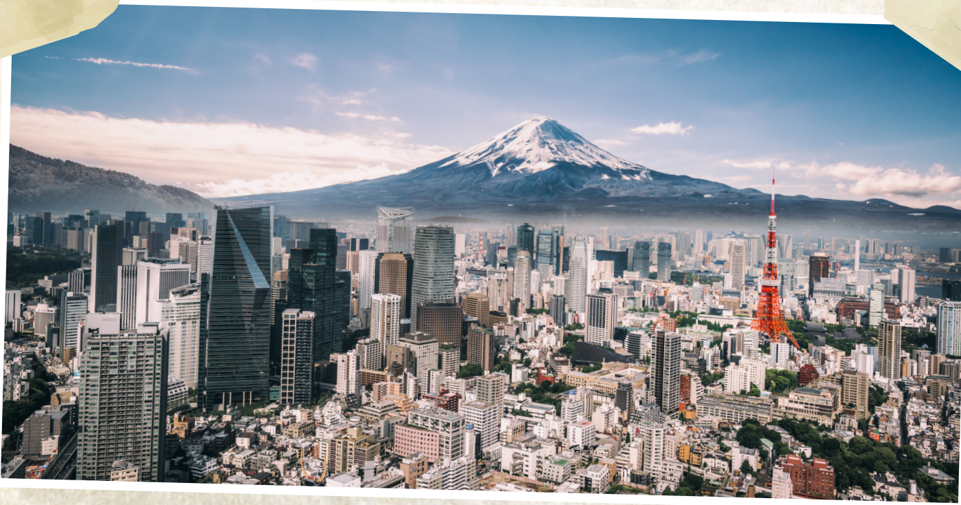
La ville de Tokyo

Quelles sont les caractéristiques d'un bon logo olympique? Le logo doit représenter la ville et le pays hôte, mais sans être trop patriotique. Les formes et les couleurs racontent l'histoire des Jeux et font référence à la culture, à l'histoire ou aux peuples autochtones d'un pays. Le logo doit pouvoir être utilisé de plusieurs façons. Il sera placé tant sur les bâtiments que sur les médailles et les casquettes. Finalement, il doit être visible lorsqu'il est petit et bien paraître lorsqu'il est affiché en une seule couleur.