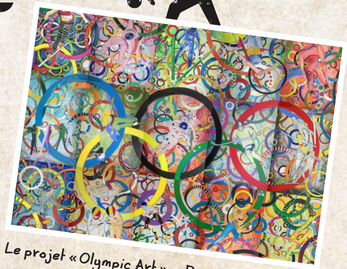
Le projet « Olympic Art » - PyeongChang

Les Jeux olympiques d'hiver de Pyeongchang 2018 ont fait quelque chose d'unique pour soutenir les arts. Les organisateurs ont demandé aux athlètes olympiques qui étaient aussi des artistes de peindre un tableau représentant chacun des sports d'hiver. Un nouveau tableau a été peint pendant chacun des 15 jours des Jeux. Tout cela faisait partie du projet « Olympic Art ».