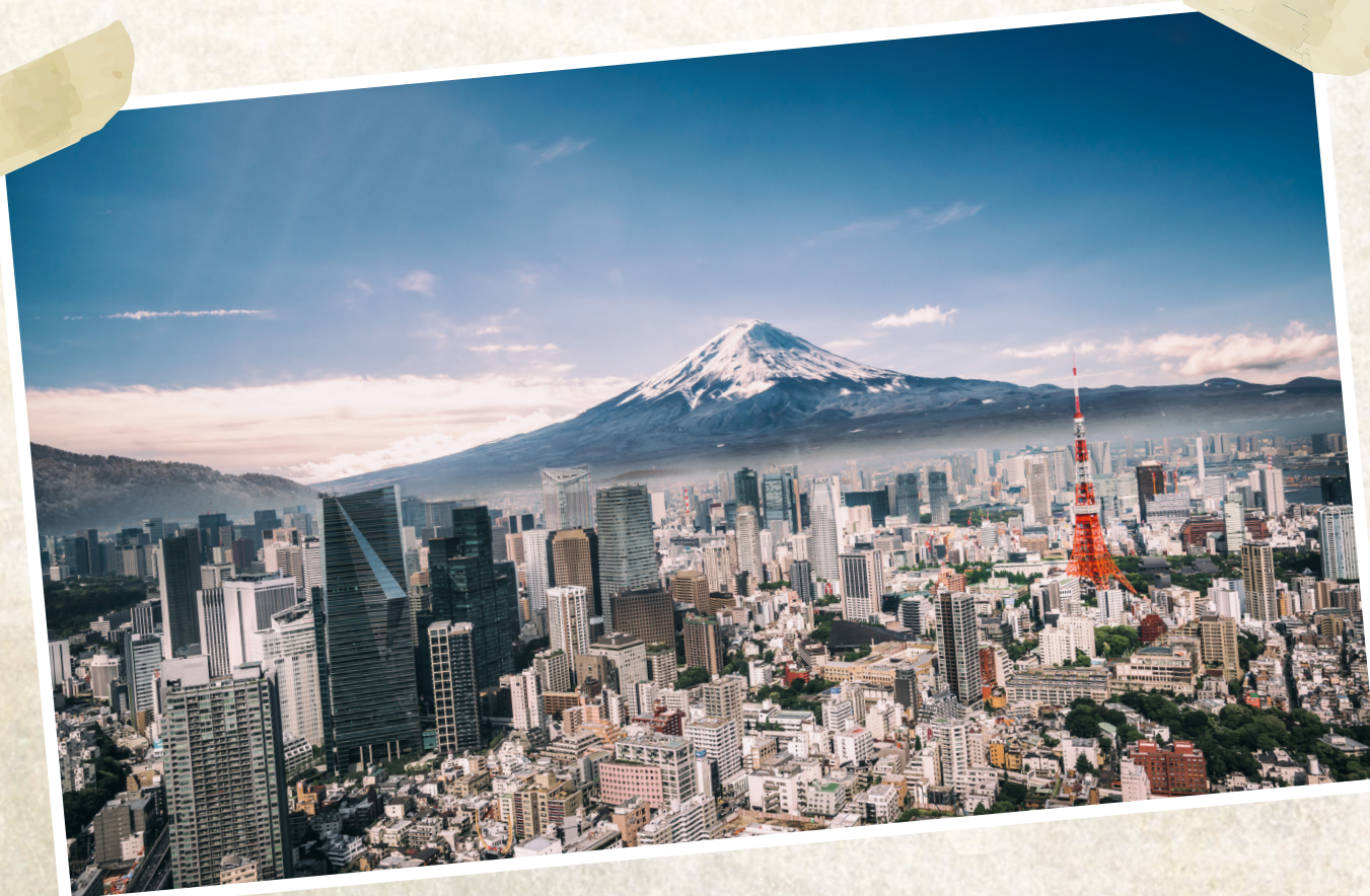
La ville de Tokyo

Quelles sont les caractéristiques d'un bon logo olympique? Le logo doit représenter la ville et le pays hôte sans toutefois être trop patriotique. Souvent, il reflète la culture ou l'histoire du pays, ou encore ses peuples autochtones. Par les couleurs ou les formes du logo, on raconte une histoire sur la région. Enfin, le logo doit être fonctionnel. Il doit en effet pouvoir figurer tant sur les bâtiments que sur les médailles et les casquettes.