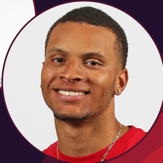
ANDRE DE GRASSE ATHLÉTISME

L'excellence consiste à donner le meilleur de soi, sur le terrain de jeu ou dans sa vie professionnelle. Le plus important ce n'est pas de gagner, mais de participer, de progresser et de bénéficier de la combinaison saine du corps, de l'esprit et de la volonté