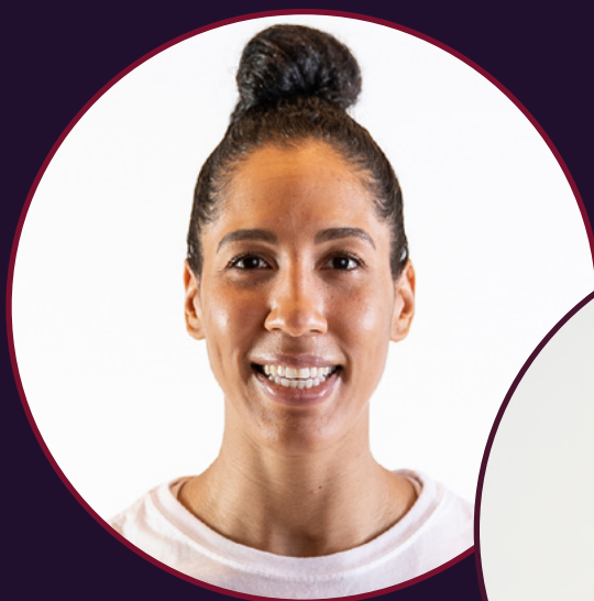
MIRANDA AYIM BASKETBALL