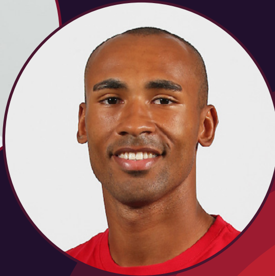
DAMIAN WARNER ATHLÉTISME