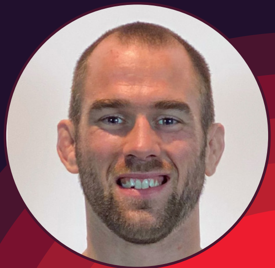
ANTOINE VALOIS-FORTIER JUDO

Cette valeur comprend « le respect de soi-même et de son corps, mais aussi des autres, des règles et règlements, du sport et de l'environnement ».