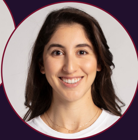
SARAH PAVAN ET MELISSA HUMANA-PAREDES VOLLEYBALL DE PLAGE